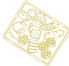
Planche de fromage et de charcuterie